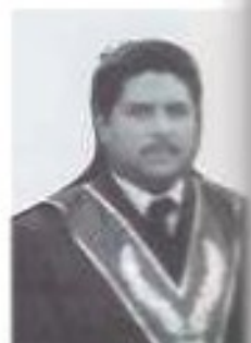
V.M. 2014 R.H. Pablo Yachay