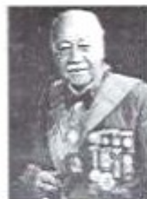
V.M. 1969 R.H. Miguel Montecarlo Wai