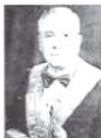
V.M. 1898 R.H. Luis Cordero Díaz