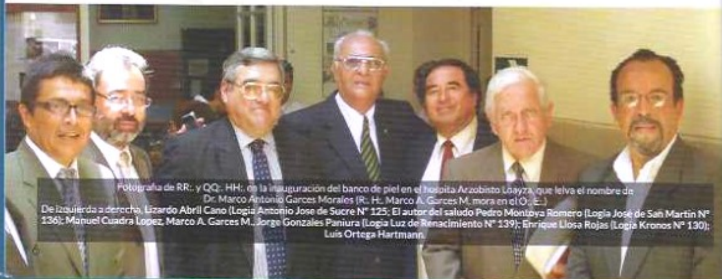
Fotografía de RR. y QQ. HH. de la inauguración del banco de piel en el Hospita Arzobispo Loayza, que lleva el nombre de